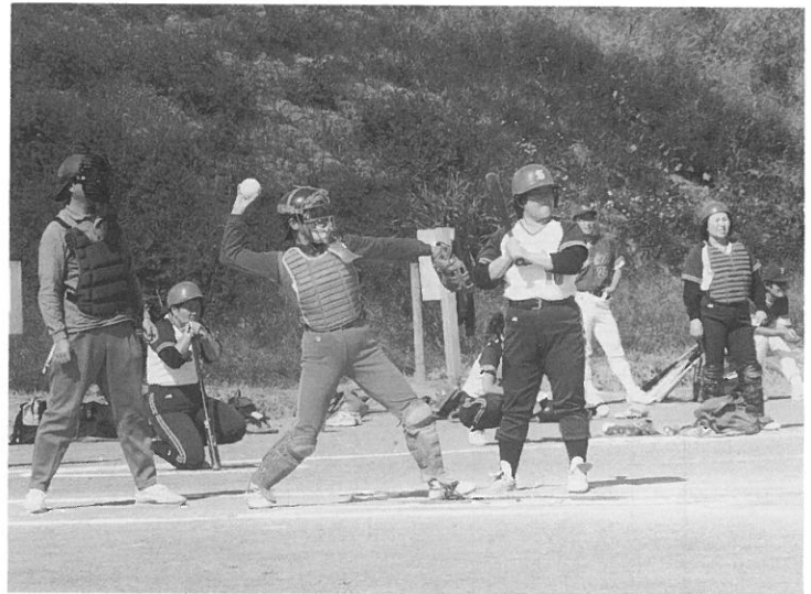
第20回市民ソフトボール大会