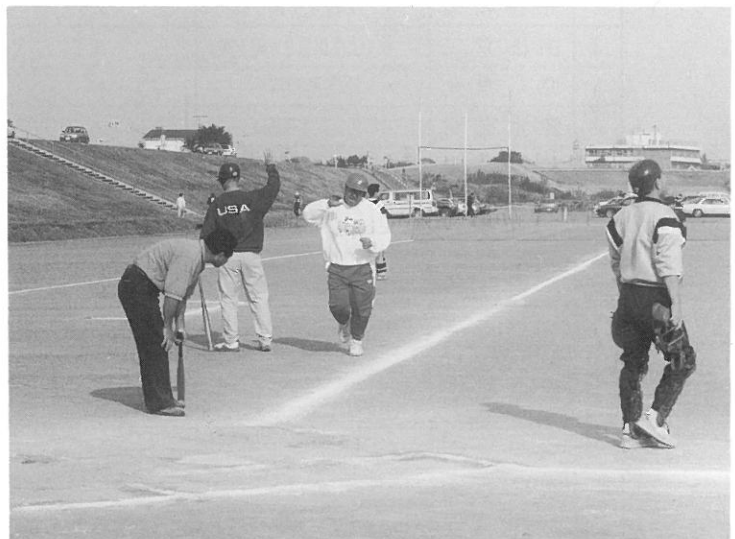
第1回ふれあいソフトボール大会