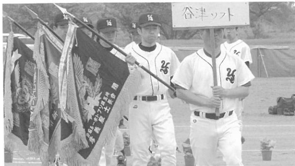
2003、2004年 谷津ソフト 3大会連覇

男子1部 ②谷津ソフト ③富士見クラブ 男子2部 ②松原小PTA ③むつみソフト 男子3部A ②ネクスト ③赤見台ビートルズ 男子3部B ②川里ロイヤルズ ③オオツカハイテック 一般女子 ②ひまわり ③バイオレット 小学生女子 ②田間宮ブルー ③鴻巣フラワーズ パワーズクイーン